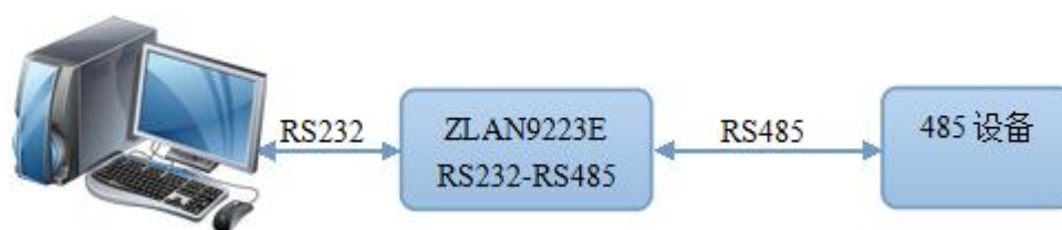
图 1 连接示意图

ZLAN9223E 型转换器、能够将 RS-232 串行口的 TXD 和 RXD 信号转换成两线平衡半双工的 RS-485 信号，无需外接电源。可直接从 RS-232 端口的 3 脚窃电，同时由 7 脚请求发送（RTS），4 脚数据终端准备好（DTR）给 ZLAN9223E 辅助供电，RS232 流控脚内部短接，实现自动的流控。