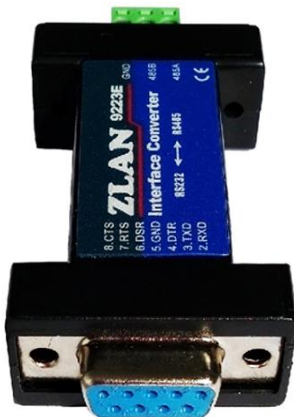
图 3 RS232 线序图