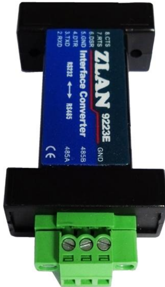
图 2 RS485 接线